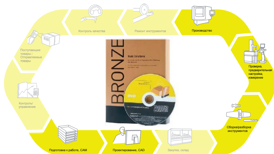
Схема производственного процесса: на этих этапах используется пакет BRONZE