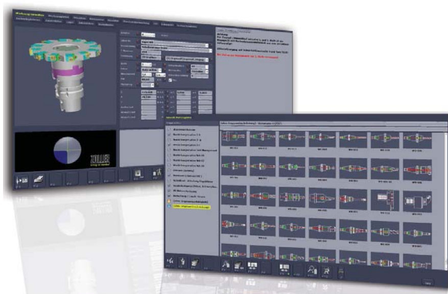
Четкое управление данными инструментария с помощью ZOLLER TMS Tool Management Solutions