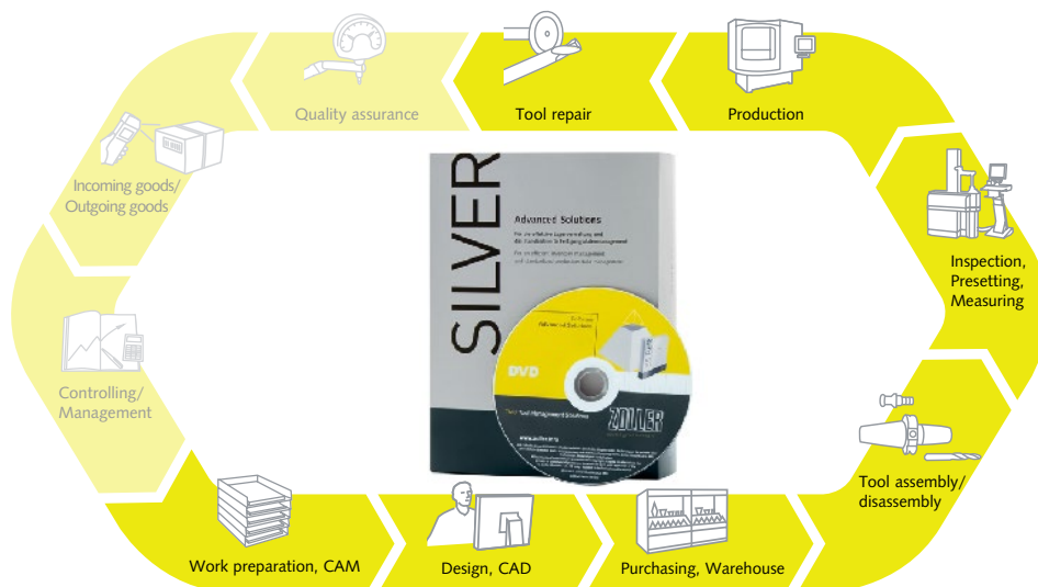
Обзор производственного процесса: эти шаги включены в пакет SILVER