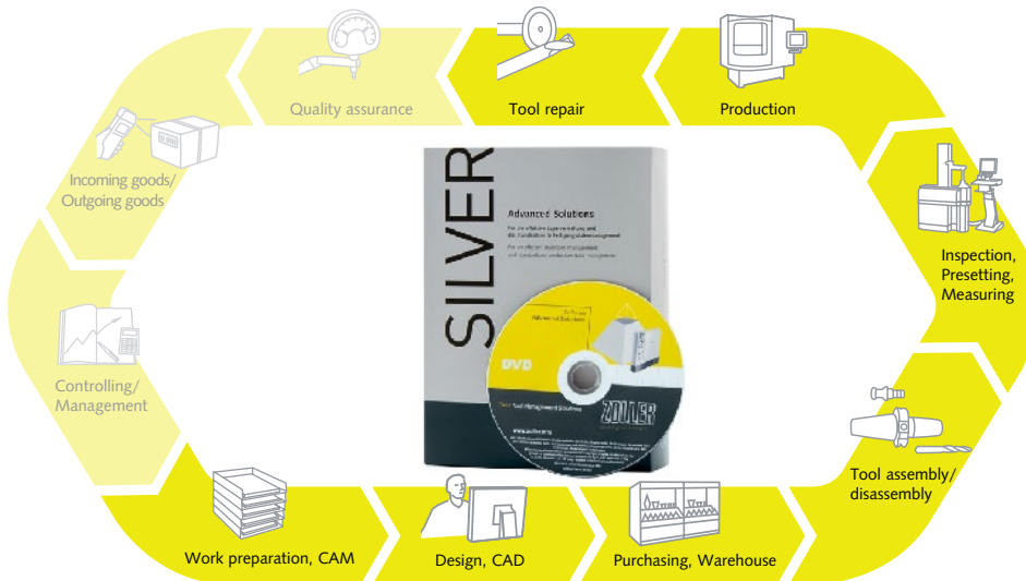
Обзор производственного процесса: эти шаги включены в пакет SILVER